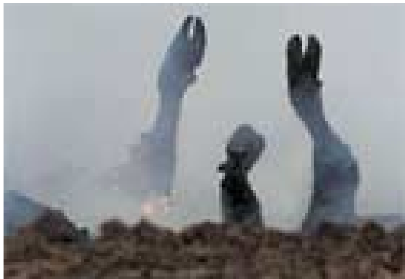
Moderne Apokalypse: Scheiterhaufen für BSE- und MKS-notgeschlachtete Tiere

Das Kostümfest, diese immerwährende Loveparade der Ziel- und Zügellosigkeit, der Beliebigkeit und der Oberflächen-Buntheit, geht unaufhaltsam dem Ende entgegen, denn er ist längst zum Tanz auf dem Vulkan geworden. Ein letzter Rausch, ein letztes großes Aufbäumen, dann wird er – wenn es günstig läuft – im großen Katzenjammer enden. Dann aber bricht das neue Zeitalter an, wird der kommende Gott sein Zepter schwingen, wird die Welt in neuen Farben erstrahlen. Dann auch wird der wahre Nietzsche, der Religionsstifter, deutlicher denn je zu erkennen sein, denn „jeder Philosoph verbirgt auch eine Philosophie; jede Meinung ist auch ein Versteck, jedes Wort auch eine Maske“ 30 , und