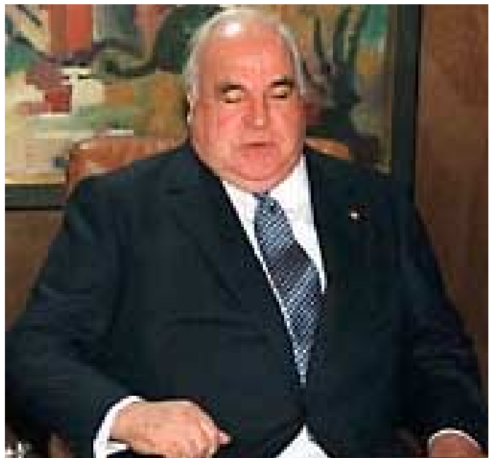
Regierungskriminalität macht Spass: Ex-Bundeskanzler Kohl

Das ist der Höhepunkt der Postmoderne: Es existieren keine wirklich bewegenden Kräfte mehr, die in der Lage sind, Politik zukunftsweisend zu beeinflussen oder gar zu gestalten. Die Parteien unterscheiden sich kaum noch, ob nun in der Regierung oder Opposition. Und wohin man auch schaut, um die Parteien der westlichen Demokratien ist es nirgendwo gut bestellt. Selbst in Deutschland, diesem demokratischen Musterlände, hat sich herausgestellt, dass die halbe ehemalige Kohl-Regierung – bis zum damaligen Bundeskanzler – korrupt und kriminell ist. Und wie korrupt der Staat selbst ist, zeigt sich im Umgang der Strafjustiz mit diesen Leuten, die alle, das ist absehbar, ungeschoren davon kom-